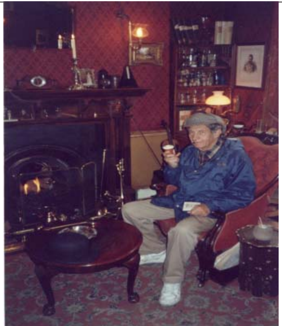
En el estudio del famoso detective Sherlock Holmes en la calle del panadero (Baker Street, Londres).