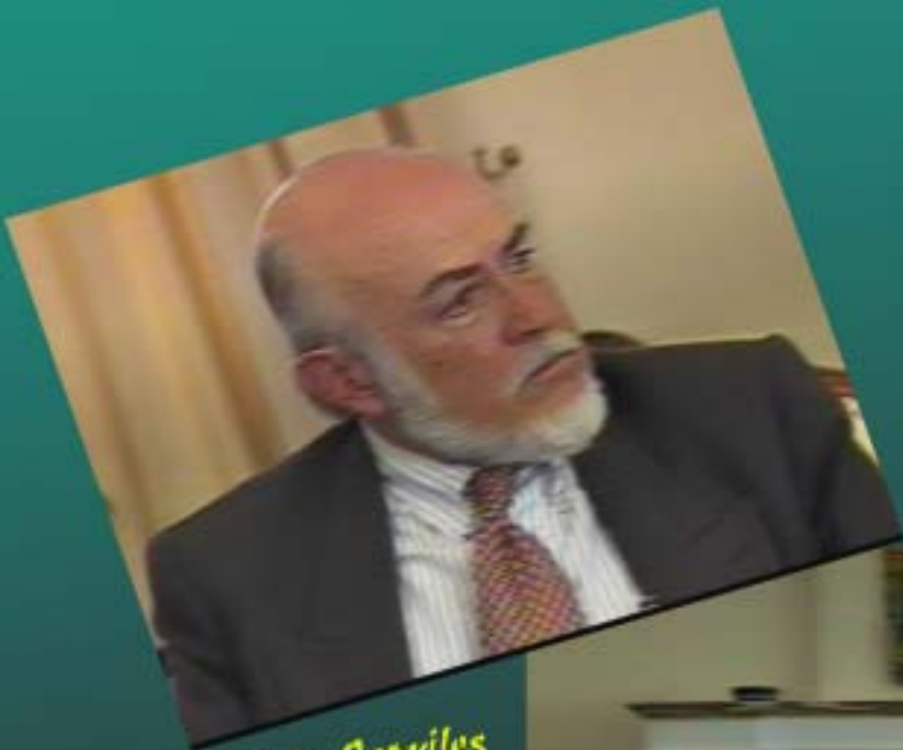
Jorge Asin Capriles

Bolivia en comunicación y diálogo internacional con personajes del mundo actual. En inglés con traducción al español.